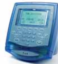
Terminal blau translucent